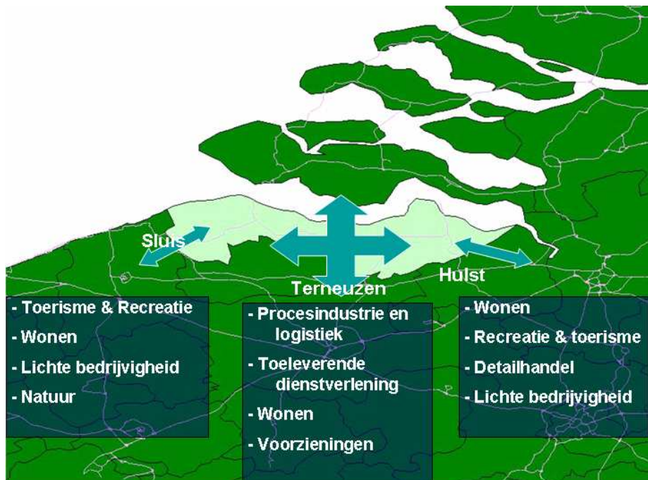
Figuur 3.1 Positionering van Zeeuws-Vlaanderen in breder verband

Tezamen bieden de verschillende deelregio's van Zeeuws-Vlaanderen gedifferentieerde, aantrekkelijke vestigings- en verblijfsmilieu's aan bewoners, bedrijven en bezoekers die weliswaar verdere versterking behoeven maar gegeven de kwaliteiten het gebied daarnaast ook “apart” maken.